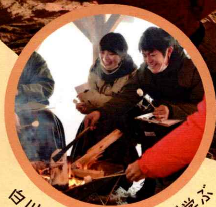
白川郷の文化を現地で学ぶ

世界遺産・白川郷は毎年2m以上の雪が積もる豪雪地帯。 「結（ゆい）」の心が根付くこの地で、助け合いの大切さを 体験しながら学びましょう。