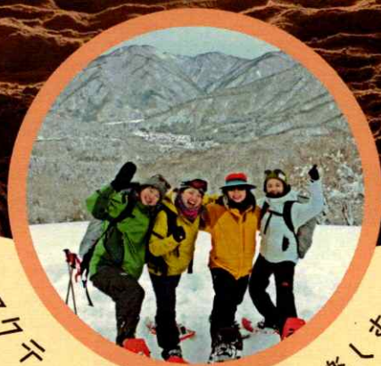
アクティビティを思い切り楽しむ！